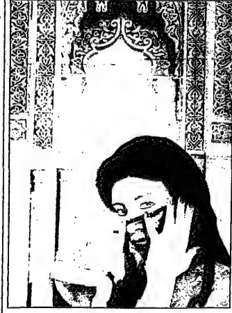
عنان - القدس العربي - من جمال تشويكي